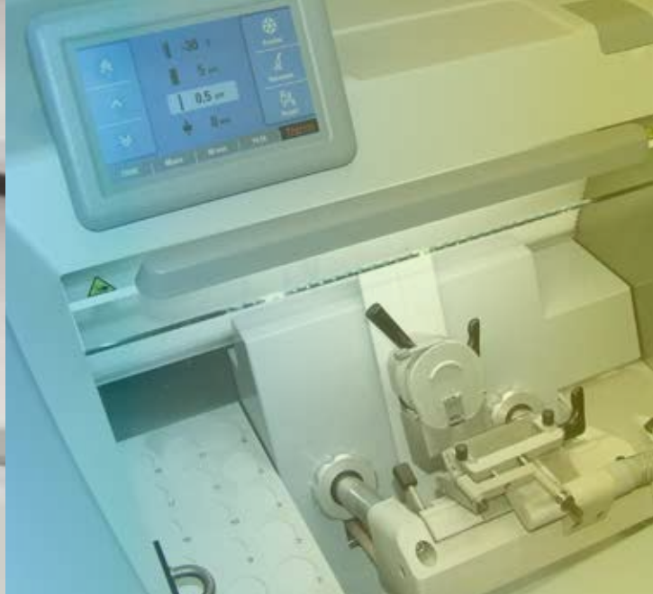
Thermo Scientific CryoStar NX50 Cryostat