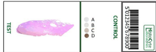
Figure 2. Positionnement d’une coupe et des spots contrôle sur lame.